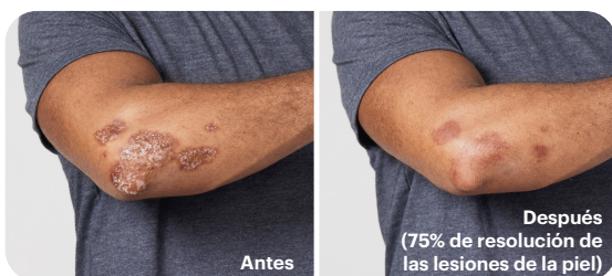
Ilustración de la resolución de las lesiones de la piel en personas con placas cutáneas causadas por la APs de moderada a intensa. Los resultados de cada persona pueden ser distintos.

*RINVOQ no se ha estudiado en la psoriasis en placas ni está indicado para tratarla.